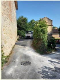
PUYCALVEL Rue Fontorbe réhabilitation d'un branchement

Linéaire réseau réhabilité en régie : 1890 m