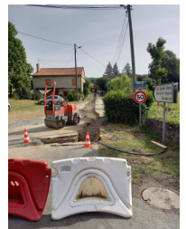
SERVIES Route des Fontaines

Ent PHUSIS TP Réhabilitation de 112 m de réseau 3 000 € HT