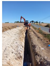
JONQUIERES St-André jusqu'à La Fontésié

Réhabilitation de 600 m de réseau 105 000 € HT