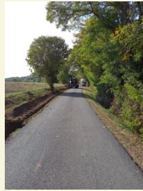
GUITALENS L'ALBAREDE En Roussel, Le Trel, Moscou réhabilitation de 1340 m de réseau