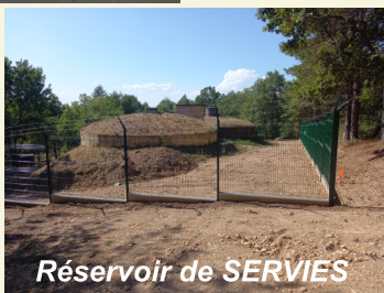
Réservoir de SERVIES

Travaux financés avec le concours du département du Tarn