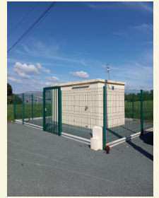
GUITALENS L'ALBAREDE Station du Potier Aménagement et pose de clotures