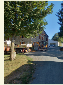
JONQUIERES Fontbal, Les Massacariès, St- André réhabilitation de branchements