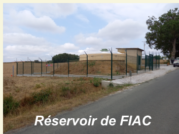
Réservoir de FIAC