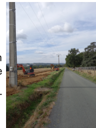
JONQUIERES La Fontésié jusqu'à Braconnac

Réhabilitation de 1000 m de réseau 117 000 € HT